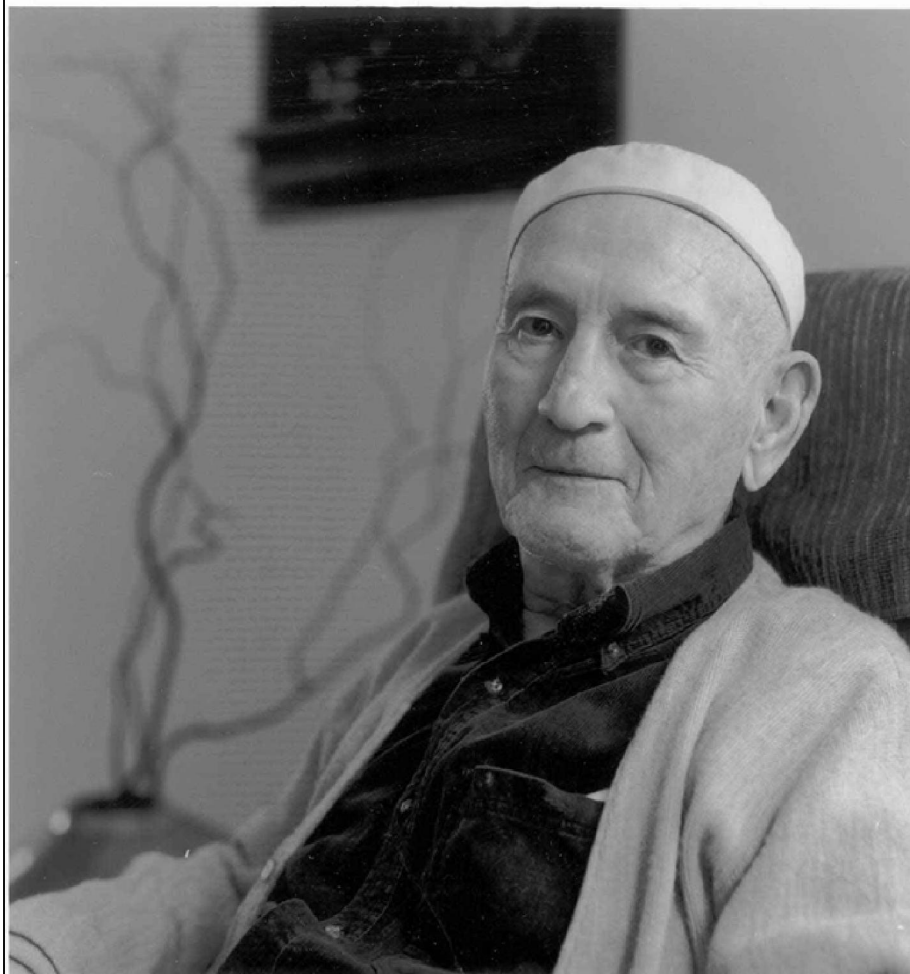
Lão sư Philip Kapleau (hình chụp năm 2002)

Vào đầu tháng 5 năm 2004, Lão sư Philip Kapleau cảm thấy pháp thể khiếm an, mặc dù được các hàng đệ tử tận tình chăm sóc chữa trị, nhưng vì tuổi cao sức yếu, Ngài đã không qua khỏi. Ngài đã an tường xả báo thân lúc chiếu ngày thứ năm, 6 tháng năm 2004 (nhằm ngày 18 tháng 3 năm Giáp Thân, trụ thế 92 tuổi đời, 49 tuổi đạo.