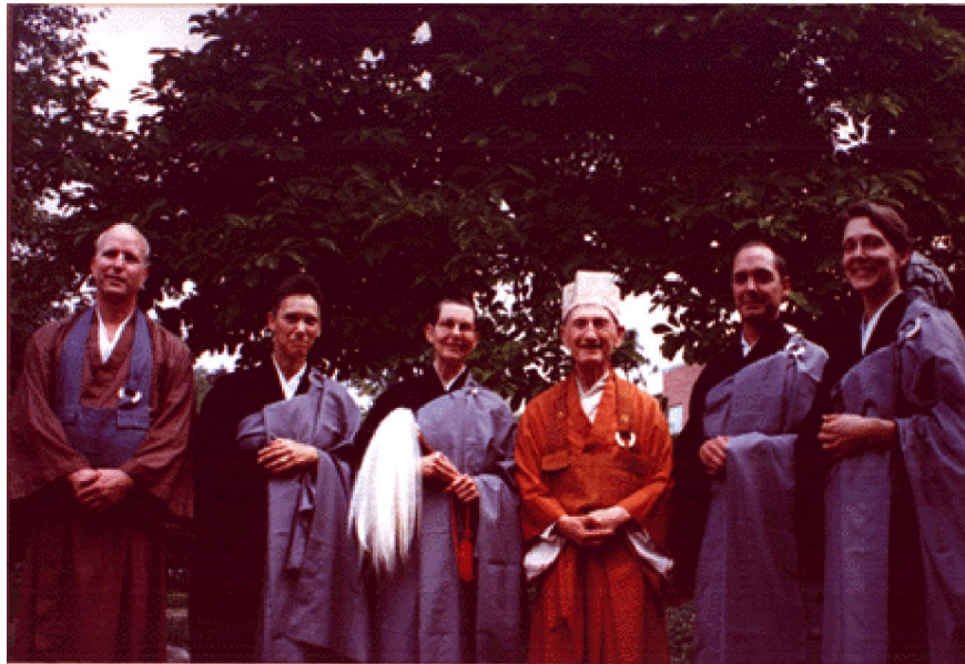
Thiền Sư Philip Kapleau và các đệ tử

Ông Philip Kapleau, được xem là một trong những Thiền sư người Mỹ đầu tiên, một Thiền sư người phương Tây nổi tiếng ở khắp nước Mỹ và các nước ở châu Âu. Ông sinh năm 1912 trong một gia đình theo đạo Tin Lành ; ông học ngành luật và sau khi ra trường làm thư ký nhiều năm ở Tòa án Liên bang Mỹ. Trong thế chiến thứ II (1939-1945), ông được chỉ định làm báo cáo viên tại hai phiên tòa xử tội ác chiến tranh Tòa án Quân sự Quốc tế tại Nuremberg-Đức và tại Tokyo-Nhật Bản. Đây cũng là nhân duyên đẩy đưa ông đến với Phật giáo (PG).