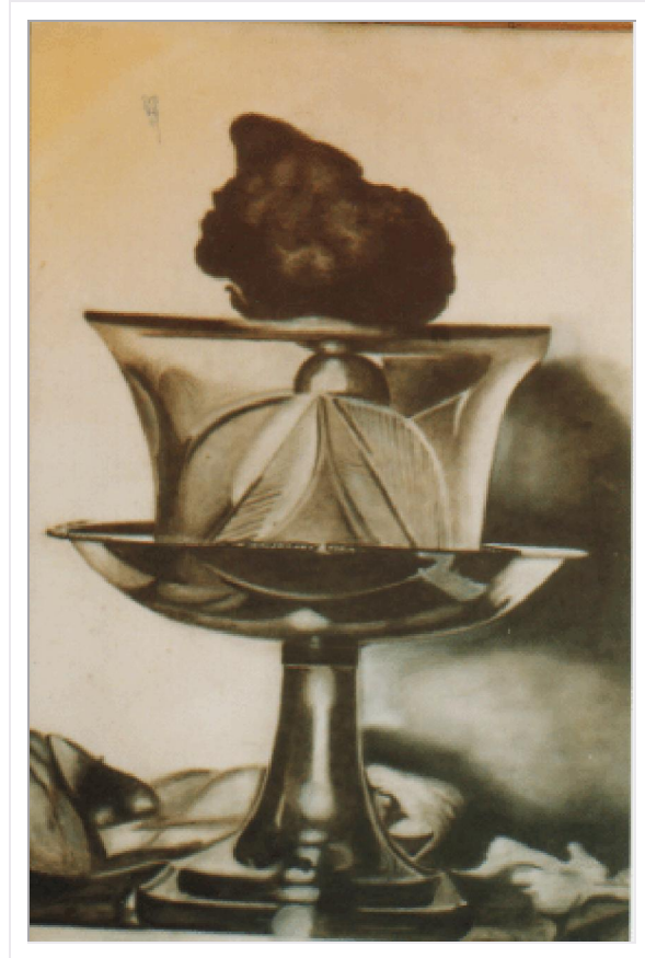
Trái tim bất diệt của Bồ Tát Thích Quảng Đức

Dù ngài đã thị tịch, nhưng hình ảnh của ngài vẫn khắc sâu in đậm vào lòng của người con Phật. Cái chết vô cùng cao quý của ngài đã gây xúc động mạnh trong mọi giới, là một gương sáng cho toàn thể Phật giáo đồ trên khắp thế giới.